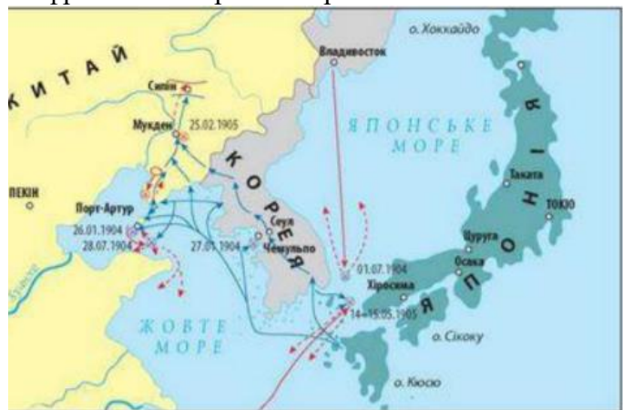
Японія в кінці ХІХ – на початку ХХ століття

Та по завершенні війни японська казка добігла кінця. США та європейські країни повертають собі контроль над ринками збуту. Це супроводжується погіршенням економічного становища Японії, яке переростає у кризу 1920-21-го років.