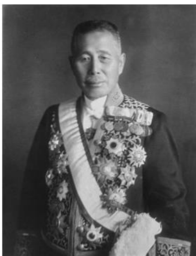
Генерал Танака Гііті