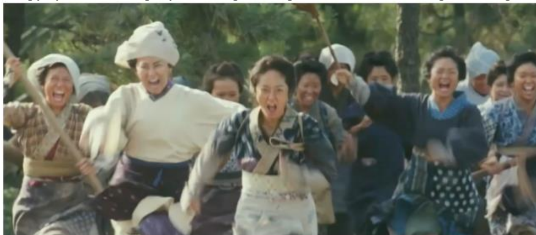
Фрагмент трейлера до фільму «Рисові бунти» (2021)

Ціни на харчі зросли в рази. Рис, якого не вистачало простому люду, став головним багатством. Ще в серпні 1918 року в Японії спалахують народні заворушення, так звані «Рисові бунти». Влада їх жорстоко придушує. Загострив становище японців Рут Бенедикт Японія в кінці XIX – на початку XX століття і землетрус у Токіо 1923 року, який приніс страшні людські та матеріальні втрати.