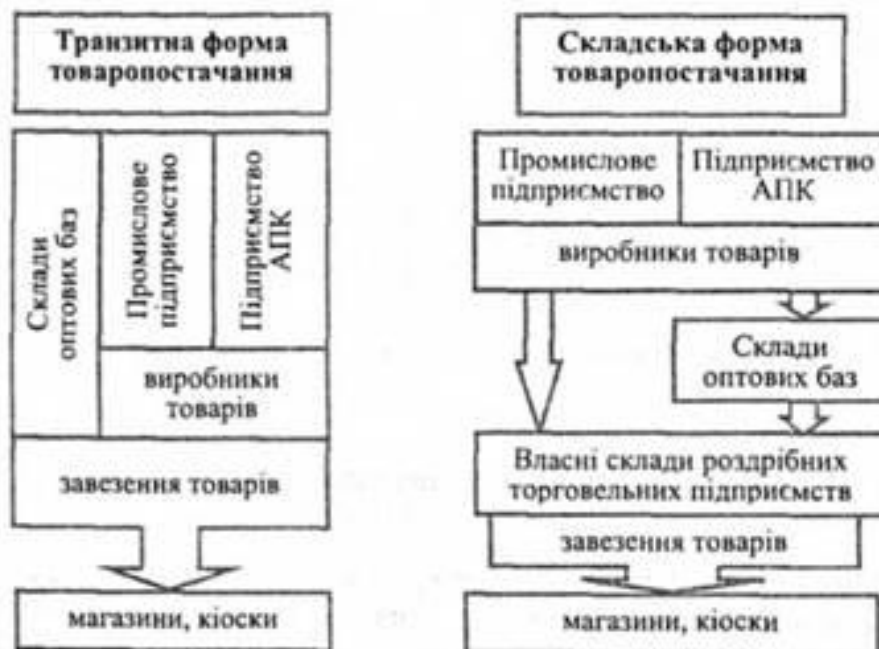
Рис. 4. Форми товаропостачання роздрібної торговельної мережі

Транзитну форму товаропостачання використовують, як правило, для великих спеціалізованих та універсальних магазинів. Транзитна форма товаропостачання сприяє прискоренню обігу товарів, зменшенню повторних