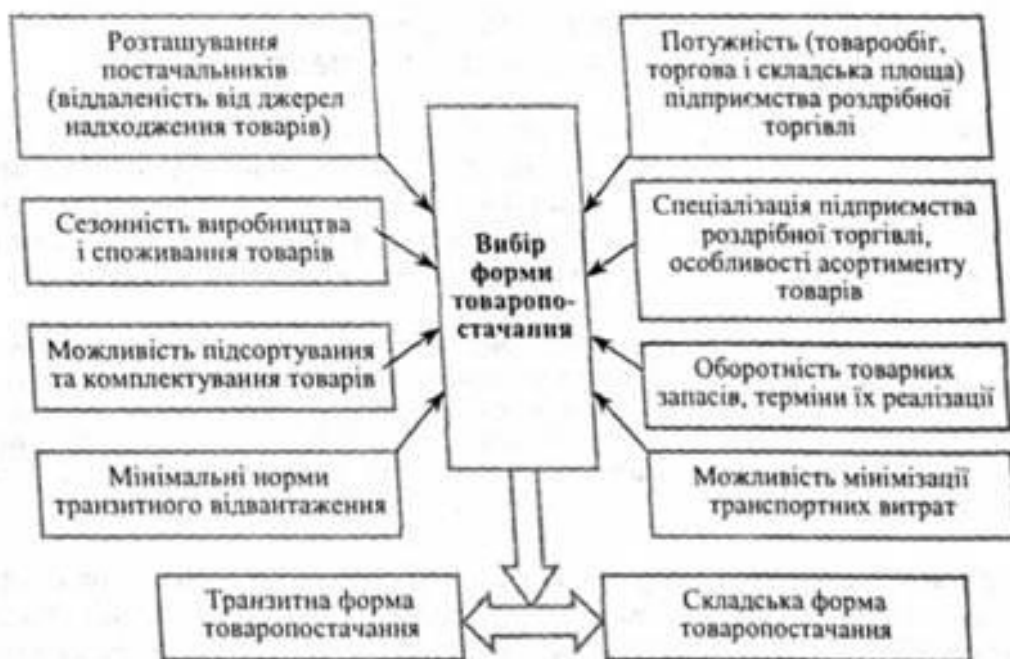
Рис. 5. Основні фактори, які впливають на вибір форми товаропостачання

додаткового комплексу складських операцій, повторного виконання завантажувально-розвантажувальних робіт, що призводить до зростання витрат обігу підприємств торгівлі. Тому працівники торговельних підприємств повинні визначати доцільність вибору транзитної або складської форми товаропостачання на основі врахування конкретних умов діяльності підприємства (рис. 5), економічних наслідків прийнятого рішення та запитів населення щодо асортименту товарів у підприємствах роздрібно торгівлі. Так, наприклад, при складській формі товаропостачання існує можливість сформуванню в магазинах ширший асортимент товарів, що сприяє повнішому задоволенню попиту населення і нарощуванню обсягів роздрібного товарообігу.