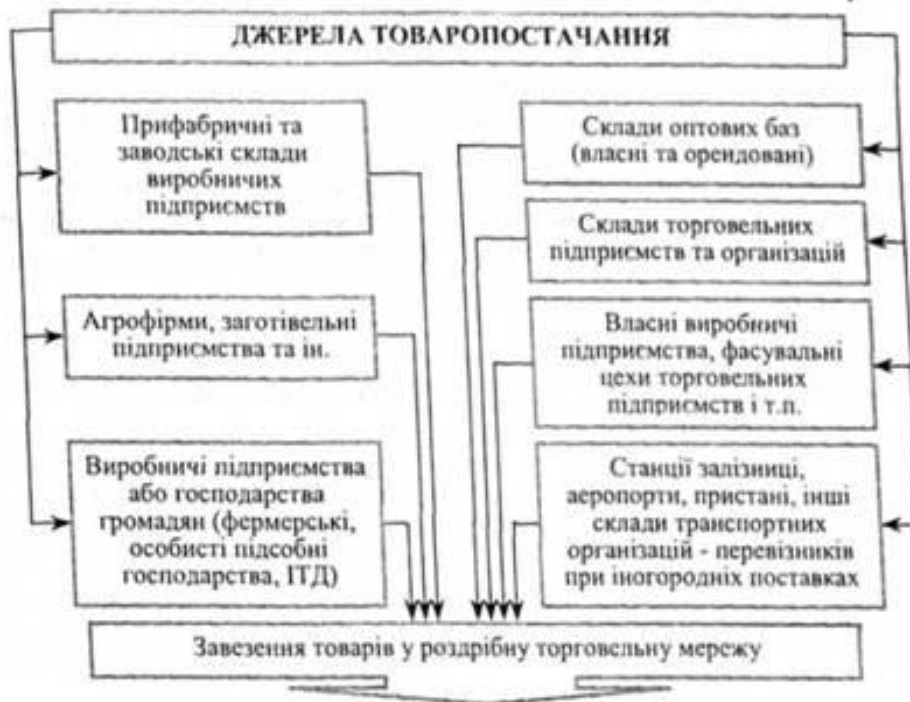
Рис. 3. Основні джерела завезення товарів у підприємства роздрібної торгівлі