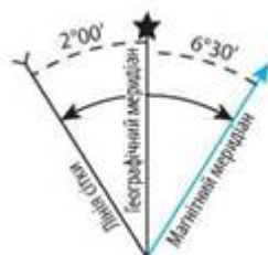
Мал. 1. Взаємне положення меридіанів на топографічних картах.

За основний вихідний напрямок береться напрямок географічного меридіана. На схемах взаємного положення меридіанів, розміщених на топографічних картах, його позначають зірочкою, магнітний меридіан — прямою стрілкою, осьовий меридіан — зворотною стрілкою (мал. 1).