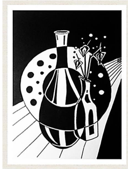
Додаток 2 Композиційний центр

важливою, а отже, і організації композиційного центру. Центр в основному несе смислове навантаження, висловлює художній образ твору, впливаючи на глядача психологічно, викликає в нього потік асоціацій, розвиваючи уяву, змушує співпереживати. (Додаток 2)