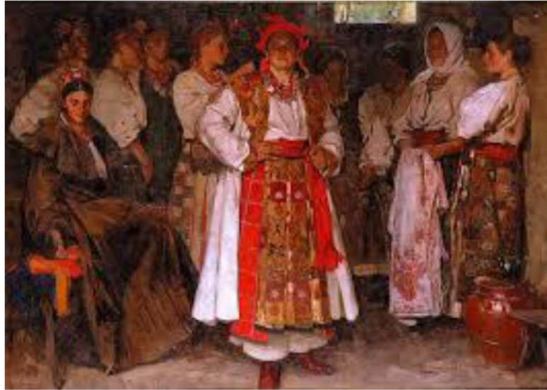
Додаток 3 Федір Кричевський «Наречена»

Обов'язково вказували ПІБ учня і номер групи