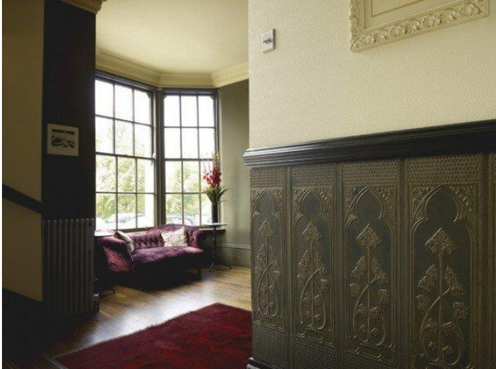
Оздоблення стін лінкрустом

На нашому сайті є стаття, яка докладно розповідає про цієї технології.