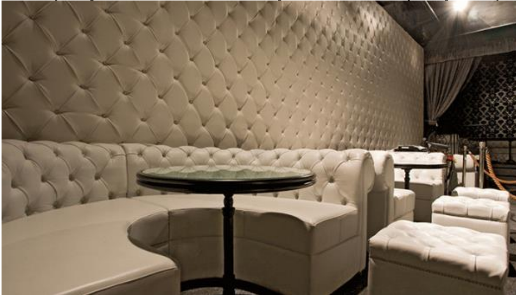
Стіни, оббиті тканиною

Якщо знайдеться тканина, ширина якої дорівнює висоті стіни, то смуга буде цілісна, без швів. Після того, як з тканиною розібралися, приступають до виготовлення дерев'яного каркасу та зміцнення на ньому листів гіпсокартону або фанери.