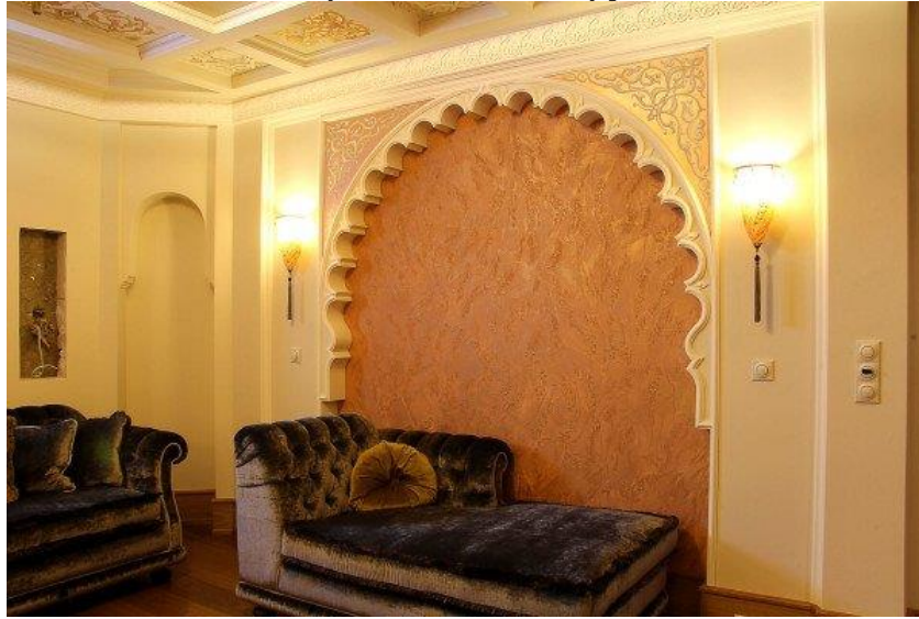
Ніша, декорована венеціанської штукатуркою