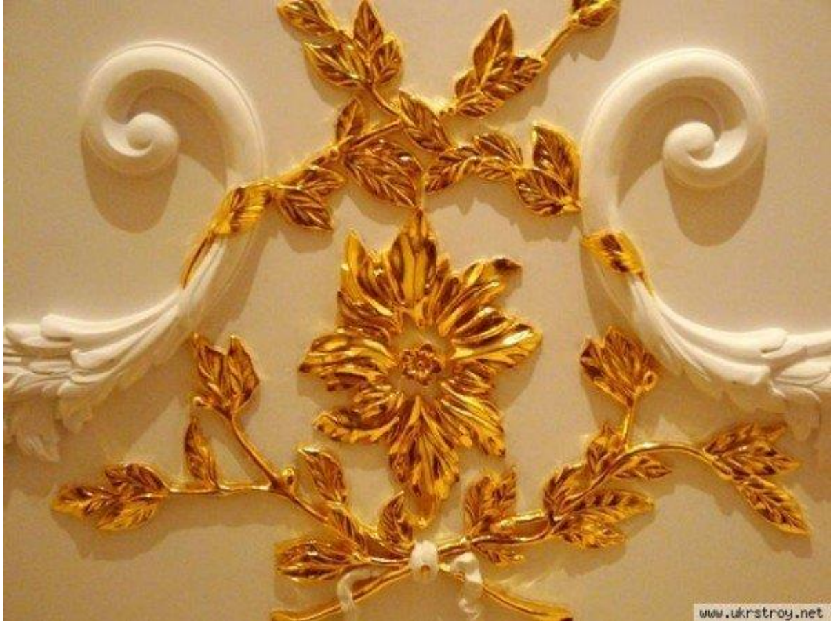
Сусальне золото в обробці ліпнини