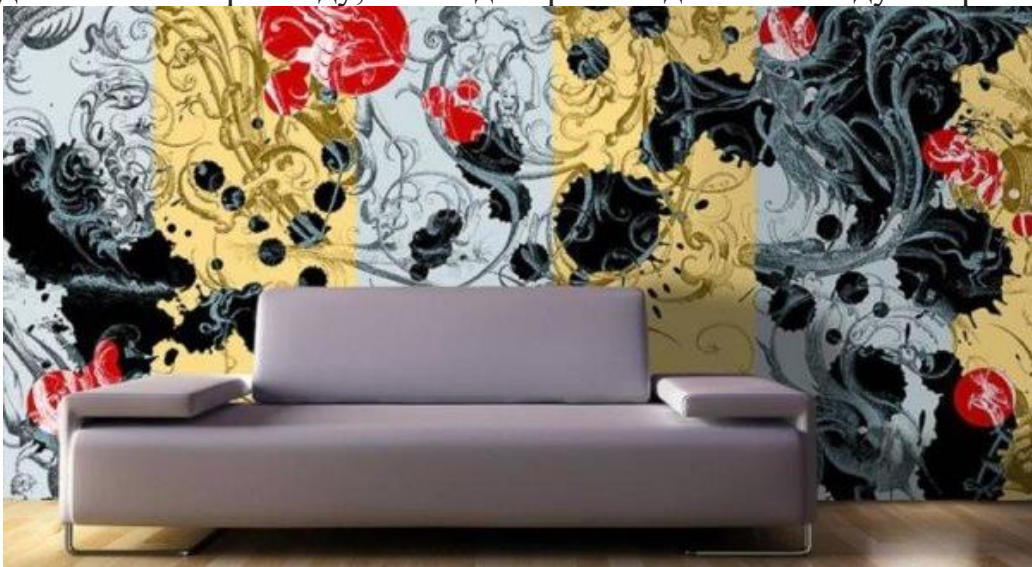
Натяжний ПВХ полотно на стіні

І, судячи з наведеного нами прикладу, такий декор виглядає на стіні дуже оригінально.