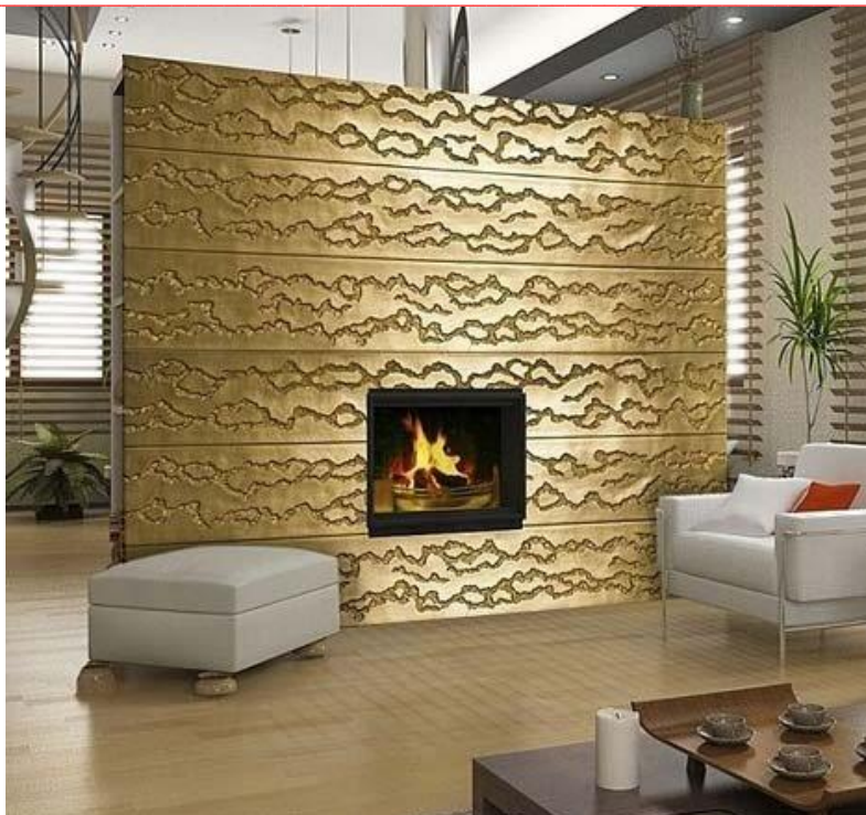
Декоративні панелі в дизайні

• Набагато простіше використовувати декоративні фактурні панелі, яких зараз на будівельному ринку безліч. І колір, при бажанні, можна вибрати золотистий. Це, звичайно, не сусальне золото, але теж виглядає дуже красиво. Ви можете в цьому переконатися, поглянувши на зображення зверху.