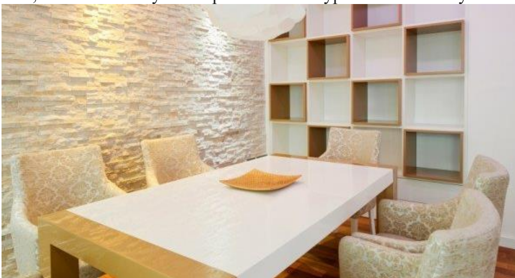
Неповторна фактура каменю

І неважливо, який камінь був використаний: натуральний або штучний.