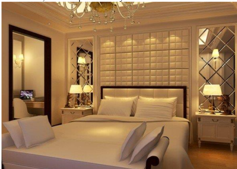
Поєднання шкіряної і дзеркальної плитки

• Досить часто для декору стіни використовують об'ємні панелі, в поєднанні з дзеркальною плиткою невеликого формату. Це можуть бути 3Д панелі з гіпсу, бамбука або шкіряна плитка, як на картині знизу.