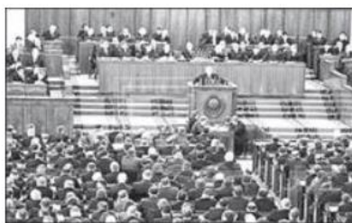
Виступ Хрущова. XX з'їзд КПРС в лютому 1966 р.

В останній день роботи з'їзду М.Хрущов протягом чотирьох годин читав доповідь «Про культ особи та його наслідки».