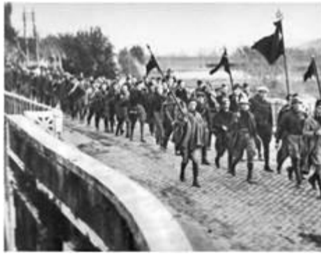
Колона фашистів прямує до Рима. Фото. 1922 р.

Поступово обмежуючи повноваження короля, Б. Муссоліні присвоїв собі титул «дуче» (вождь) і правив Італією майже одноосібно. Він заборонив усі політичні партії, окрім власної. Депутатів-нефашистів вигнали з парламенту. Сміливців, які наважувалися протестувати проти тоталітарної системи, заарештовували й відправляли до концентраційних таборів на віддалених островах або вбивали (наприклад, популярного соціаліста Джакомо Маттеотті).