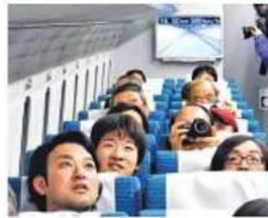
Емоції пасажирів японського поїзда на повітряній подушці на швидкості 500 км/год

Завдяки НТР найдинамічніше розвиваються країни й регіони, які не мають власної сировинної бази (Японія, яка імпортує до 95 % сировини й палива, зуміла стати високорозвиненою постіндустріальною країною). Одним з найважливіших чинників розміщення виробництва стає близькість до центрів науки й освіти. Зокрема, у Японії у 80-х роках ХХ ст. почали створювати спеціальні технополіси — міста науки, у яких зосереджені найбільш наукомісткі виробництва (радіоелектроніка, авіакосмічне машинобудування тощо). У США таким технополісом є Кремнієва долина в Каліфорнії.