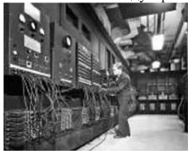
Комп'ютер ENIAC. 1945 р.

ENIAC працював на електронних лампах, важив 30 т і виконував 5 тис. операцій за секунду. У наш час мобільний телефон має більшу комп'ютерну потужність, ніж Національне управління з авіації й дослідження космічного простору США в 1969 р. Комп'ютеризація переросла в інформаційну революцію, що змінює суспільні відносини. Кінець ХХ — початок ХХІ ст. — це період перетворення індустріального суспільства на постіндустріальне, або інформаційне.