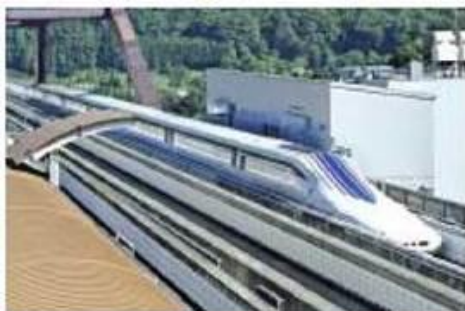
Поїзд на повітряній подушці

Швидке зростання сфери послуг зумовлене насамперед розвитком науки й технологій, освіти, культури та мистецтва, охорони здоров'я та фізичної культури, житлово-комунального господарства й побутового обслуговування, соціального забезпечення, індустрії відпочинку. Активізується торгівля новими знаннями й технологіями, патентами, ліцензіями, технічним досвідом. Цим зумовлене зростання попиту на кваліфіковану робочу силу. З іншого боку, у розміщенні виробництв велику роль відіграє не тільки кваліфікація, а й вартість робочої сили. Тому дедалі більше підприємств обробної промисловості транснаціональні компанії розміщують у країнах з дешевою робочою силою.