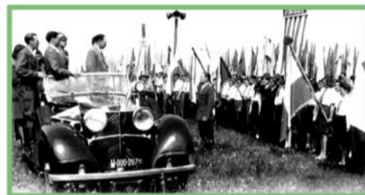
■ Б. Берут виступає перед молоддю

Значний вплив на долю повоєнної Польщі мала ялтинсько-потсдамська система міжнародних відносин, за якої держави-переможці вдалися фактично до поділу Європи, зарахувавши Польщу до радянської сфери впливу. Результатом того були рішення Сталіна щодо внутрішніх змін в країні, утворення нових елементів залежності від СРСР та ліквідація демократичної опозиції й курс на «радянізацію». У 1945 р. СРСР і Польща підписали договір про дружбу і повоєнне співробітництво. У складі польського уряду «національної єдності» переважали комуністи, які в 1947 р. на сфальсифікованих виборах здобули 80 % голосів. Президентом Польської Республіки і головою Державної ради було обрано Болеслава Берута, одного з найбільш послідовних провідників сталінізму в Польщі. У грудні 1948 р. з партій, що входили до Демократичного блоку, було утворено Польську об'єднану робітничу партію (ПОРП).