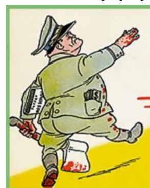
■ Радянська карикатура на маршала Й. Броз Тіто

Зміни торкнулися і правлячої партії, яка після VI з'їзду стала називатися Союзом комуністів Югославії (СКЮ) . Як було відзначено на з'їзді, партія в умовах розвитку самоврядування не могла більше відігравати директивної ролі в державному та суспільному житті. За нею зберігалось право розроблення генеральної лінії, але боротися за її втілення вона повинна була не командними методами, а методами переконання. Проголосивши самоврядування невід'ємним юридично гарантованим правом трудящих, нова конституція країни, ухвалена у квітні 1963 р., поширила самоврядувальні відносини і на установи невиробничої сфери, що було кваліфіковано як перехід до громадського самоврядування. Відповідно до основного закону країна стала називатися Соціалістичною Федеративною Республікою Югославією (СФРЮ). Отже, внутрішньополітичний розвиток Югославії значно відрізнявся від інших соціалістичних країн.