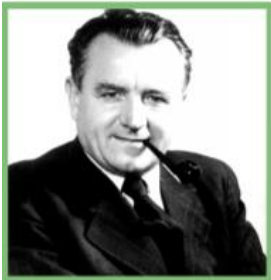
■ К. Готвальд

Територію Чехословаччини було звільнено від нацистських окупантів радянськими військами в 1945 р. Невдовзі до країни повернувся із еміграції і знову приступив до своїх обов'язків колишній президент Е. Бенеш. У 1946 р. було сформовано коаліційний уряд за участі представників усіх існуючих великих партій. Прем'єр-міністром у ньому став перший секретар Комуністичної партії Клемент Готвальд. Спираючись на підтримку радянських властей, комуністи в Чехословаччині почали розширювати і зміцнювати свій вплив, взяли під контроль основні пости в державному апараті й органах державної безпеки. Було експропрійовано маєтки землевласників і поділено між селянами. У 1945 р. націоналізовано банки, страхові компанії, металургійні заводи, шахти.