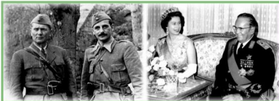
* ■ Й. Броз Тіто (зліва)

пропозицію парламент Югославії ухвалив того дня закон, який проголошував, що підприємствами як загальнонародною власністю мають керувати трудові колективи. Ці заходи призвели до реорганізації економічної та політичної системи країни. Законом від 29 грудня 1952 р. було проведено велику реформу в царині планування народного господарства: чимало функцій у цій сфері було передано республіканським і місцевим органам та підприємствам, галузеві міністерства ліквідувались.