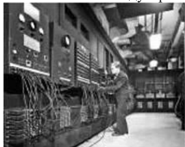
Комп'ютер ENIAC. 1945 р.

ENIAC працював на електронних лампах, важив 30 т і виконував 5 тис. операцій за секунду. У наш час мобільний телефон має більшу комп'ютерну потужність, ніж Національне управління з авіації й дослідження космічного простору США в 1969 р. Комп'ютеризація переросла в інформаційну революцію, що змінює суспільні відносини. Кінець ХХ — початок ХХІ ст. — це період перетворення індустріального суспільства на постіндустріальне, або інформаційне.