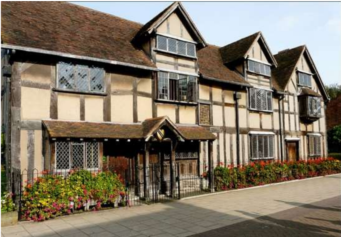
Дім-музей В.Шекспіра в Стратфорд-он-Ейвон