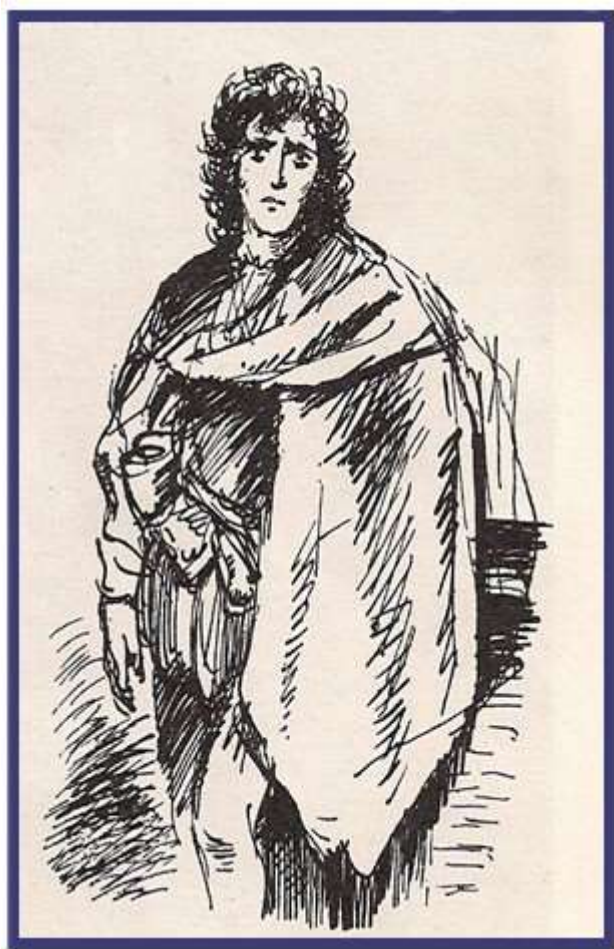
Художник Н.Кузьмін. Портрет Гамлета

донькою англійського короля і повертається до Ютландії. У фіналі він убиває Фенга і всіх придворних, які зрадили його і батька. Середньовічний Амлет — людина досить жорстока, людина дії, рішуча у своїх вчинках. Середньовічний сюжет був типовою історією про помсту. Принц Амлет виступає тут справжнім героєм, він стає королем, досягши вищої справедливості.