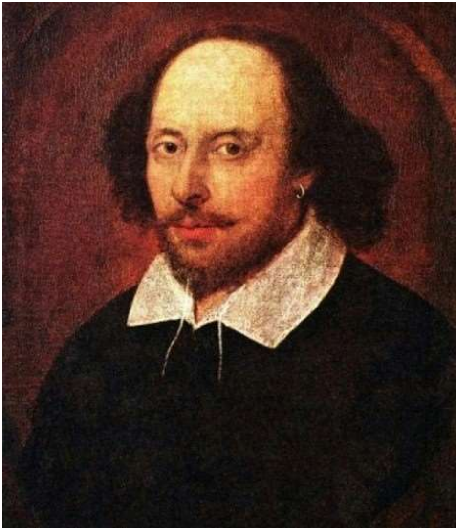
Так званий «Чандосівський портрет» невідомого, в якому традиційно бачать Шекспіра

Причини виникнення нетрадиційного погляду: