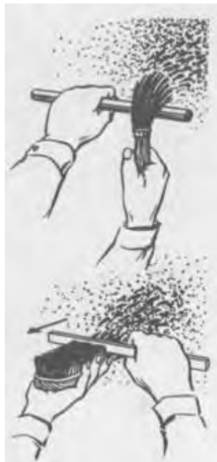
Рис. Набрискування з м'якої та жорсткої щіток.