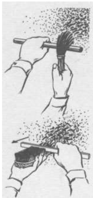
Рис. Набрискування з м'якої та жорсткої щіток.