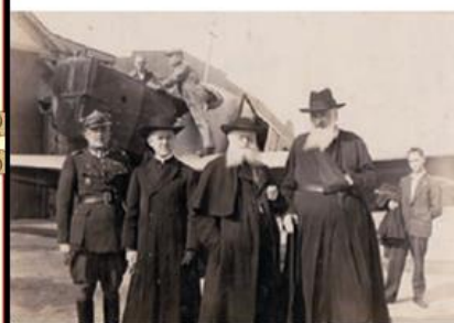
← Митрополит Андрей Шептицький (праворуч) на львівському летовищі перед вильотом до Варшави

Єдиним у Польщі легальним вищим навчальним закладом з українською мовою навчання була Греко-Католицька Львівська богословська академія , створена на базі греко-католицької семінарії з ініціативи митрополита Андрея Шептицького у 1928 р. У середині 30-х рр. в академії навчалося понад 600 студентів. Без дозволу її проти волі польського уряду у Львові виникло два заклади вищої освіти: Український університет і Вища політехнічна школа . У цих «катакомбних» закладах працювали вчені, які втратили роботу після ліквідації українських кафедр у Львівському університеті. Студенти одержували дипломи, які визнавали в Німеччині, Чехо-Словаччині, Австрії, вільному місті Данциг (Гданськ). Український університет у Львові існував майже чотири роки, до 1925-го.