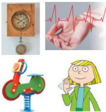
Рис. 17.1. Різні види механічних коливань

Якщо в коливальній системі немає жодних втрат енергії, то коливання триватимуть як завгодно довго — їхня амплітуда із часом не змінюватиметься. Такі коливання називають незгасаючими .