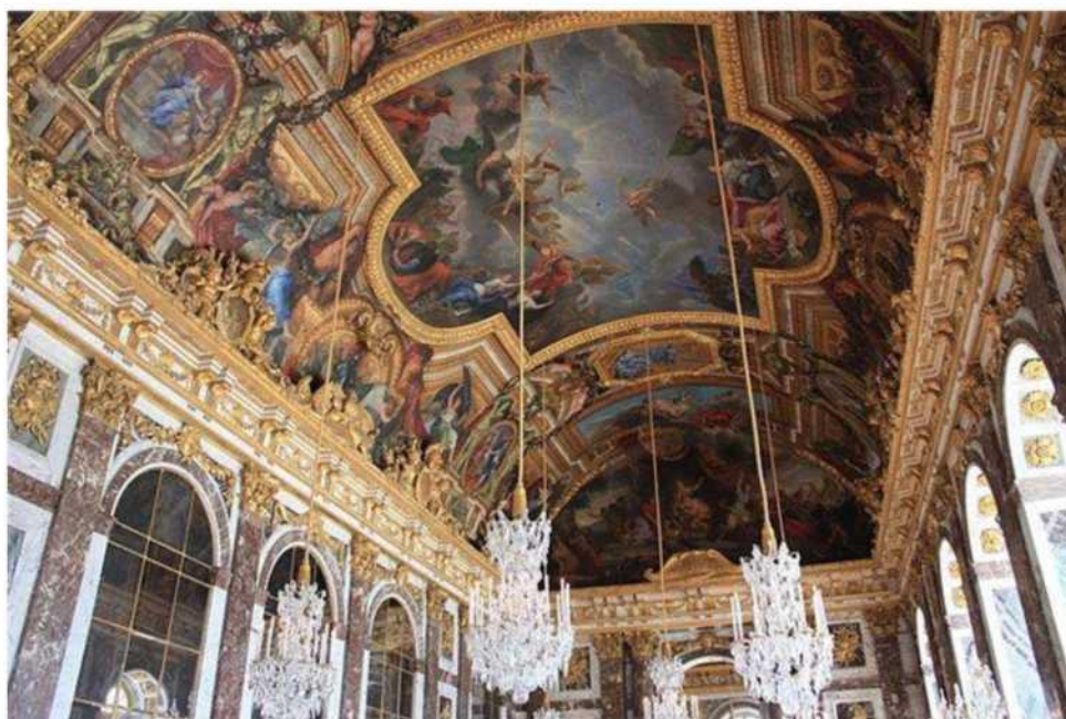
Рис. 46. Версальський дворец. Плафонна перспектива плану

Назва « плафон » походить від французького слова plafond - «по-толок»; у широкому сенсі - стеля, прикрашена мальовничим або леп-ним орнаментом, зображенням або архітектурно-декоративними мотивами (мал. 46). Звідси побудова перспективних зображень на горизонтальній площині, вживана при розписі стель (плафонів), називається плафонною перспективою .