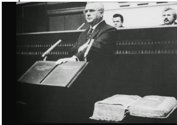
Присяга президента України Леоніда Кравчука

Переорієнтація на інші ринки потребувала часу і ресурсів. Ні того, ні того не було. Україна також не мала можливості згладити цей розрив доходами від продажу нафти і газу. Металургія, основа промисловості на той час, уже давно потребувала модернізації і сильно залежала від російського газу. Чим Росія неодноразово скористається. Водночас, Україна продовжила дотримуватися соціальних зобов'язань, достатньо високих ще за радянських часів. Держава тримала у своїй власності величезну кількість підприємств, що виїдали все більше коштів державного бюджету. Проте найголовніше — українські політики затягували з болючими, але потрібними реформами, що з кожним роком робило ситуацію лише гіршою.